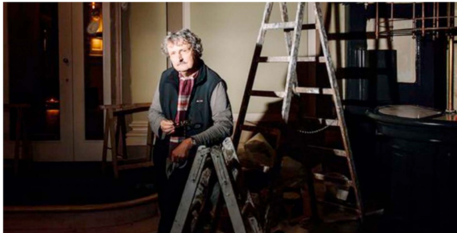
Coffret 5 DVD – Jean-François Amiguet –

L'œuvre du cinéaste veveysan Jean-François Amiguet, né en 1950, bénéficie d'un traitement royal avec ce magnifique coffret de 5 DVD, grâce au soutien de la Cinémathèque Suisse et de l'éditeur Zagora.